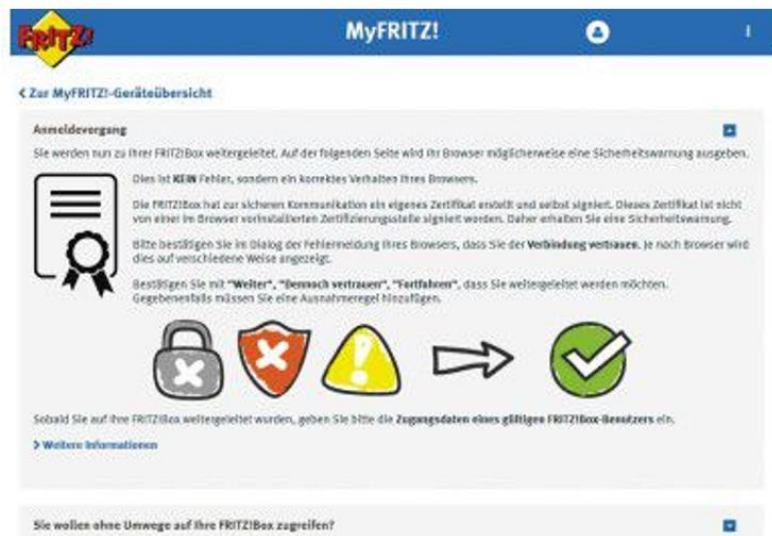
Schritt 4: Fernzugriff über MyFritz.net

Nachdem die Vorarbeiten abgeschlossen sind, wechseln Sie zur Fritzbox-Konfigurationsoberfläche und klicken im Dialog „Myfritz-Konto“ auf „Übernehmen“. Nun ist Ihre Fritzbox bei Myfritz angemeldet. Öffnen Sie im Browser die Adresse myfritz.net, geben Sie die bei der Einrichtung eingegebene „E-Mail-Adresse“ ein, aktivieren Sie „Ich bin kein Roboter“ und tippen Sie das Passwort ein. Klicken Sie auf „Zu Ihrer FRITZ!Box“, um die Verbindung herzustellen. Auf der folgenden Seite, auf der Sie auf das Fritzbox-eigene Zertifikat aufmerksam gemacht werden, klicken Sie erneut auf „Zu Ihrer FRITZ!Box“. Nachdem Sie die anschließende Sicherheitswarnung ignoriert haben, werden Sie vom bekannten Anmeldebildschirm begrüßt. Geben Sie Ihr Fritzbox-Benutzer-Passwort ein und klicken Sie auf „Anmelden“.