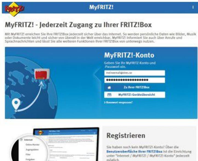
Schritt 2: Myfritz bietet mehrere Vorteile

Sehr gut: Myfritz können Sie an jedem internetfähigen Rechner nutzen, da die Steuerung direkt über den Webbrowser erfolgt. Besitzen Sie ein Android- oder iOS-Mobilgerät, installieren Sie die kostenlose Myfritz App , um auch unterwegs auf Ihre Daten zugreifen zu können.